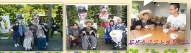
ぶどうソフトクリーム