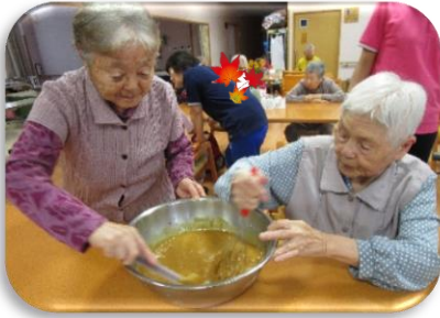
☆がんづき☆ 混ぜてふかして、フワフワの がんづきができました◎