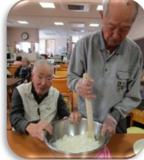
☆おはぎ☆ 程よい甘さの上品な おはぎができました！