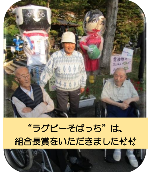
“ラグビーそばっち”は、 組合長賞をいただきました☆☆