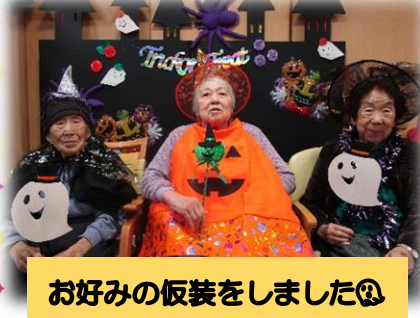
お好みの衣装をしました◎