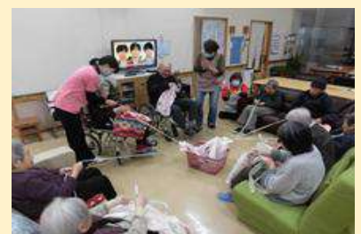
正月恒例のどっぴきゲームを行いました。何が当たるかな…わくわくドキドキ…