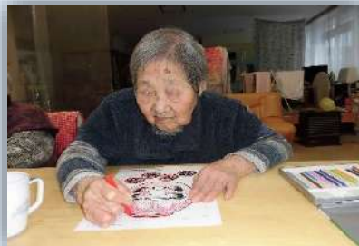
黙々と塗り絵をやっています