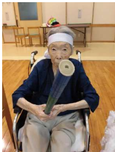
ミニ運動会では大活躍でした。 運動神経も抜群ですね！ (令和2年6月24日)

私も勉強し床屋さんとなり、結婚してから自分の店を持ちました。夫は町会議員をされており忙しく、旅行などに行けなくて残念でしたが、私のお店は佐比内小学校の真向かいにあったので、子供たちや地域の方にお越しいただき、寂しくはなかったです。