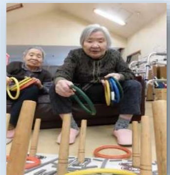
この日のレク活動は、 輪投げ大会！