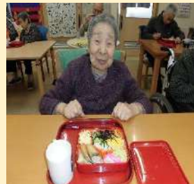
昼食におせち料理を食べました。