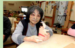
新・横綱は「へその山」！ 四股名のセンスも面白いですね