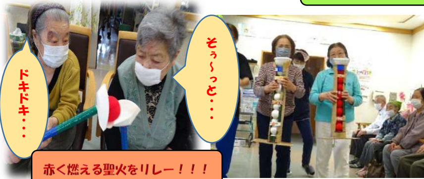
赤く燃える聖火をリレー!!!

コロナ禍の大変な中、皆さまで感染予防をしながらデイサービスに来て頂きました。 東京オリンピック~!!改め~! あづまねオリンピックを開催し、皆さま真剣に??楽しく笑い溢れる大会となりました。