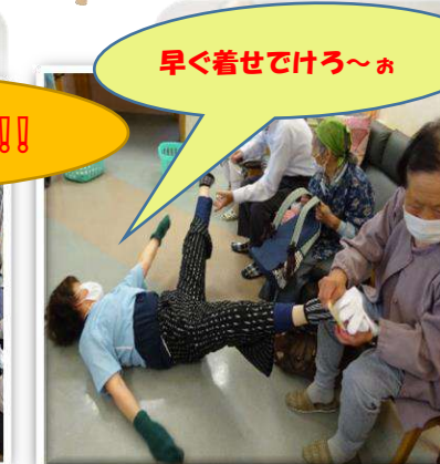
早く着せてけろ~お