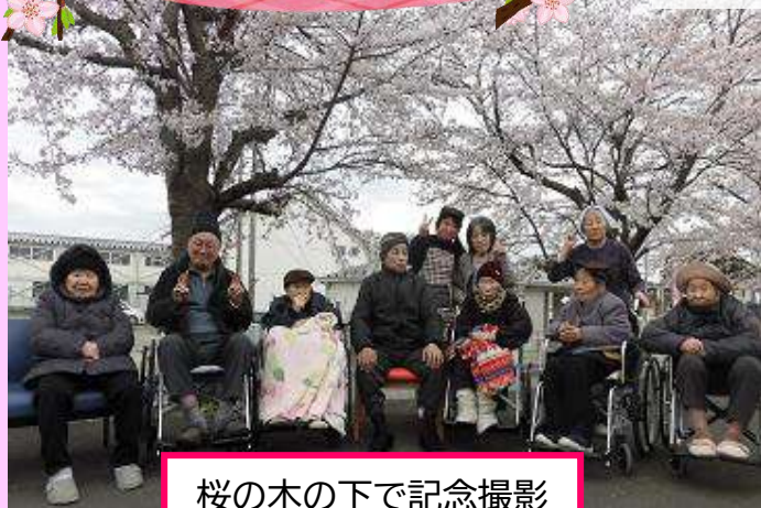
桜の木の下で記念撮影

4月16日にお花見会をしました。桜の木の下で歌を唄い、入居者様の踊りを堪能しました。今年も皆さんと一緒に満開の桜を見ることができました。