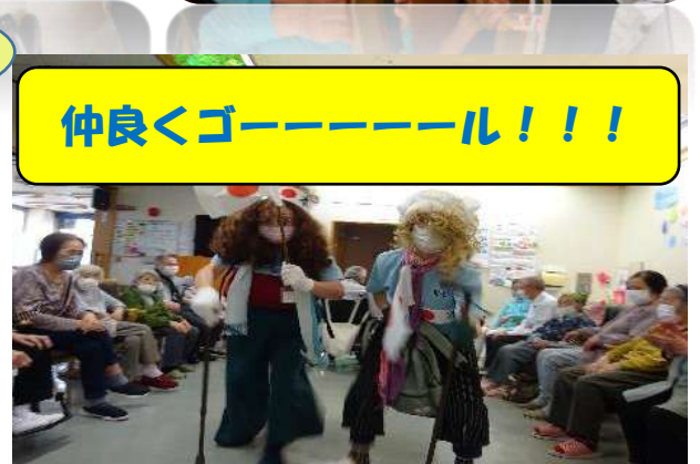
仲良くゴーーーーール!!!