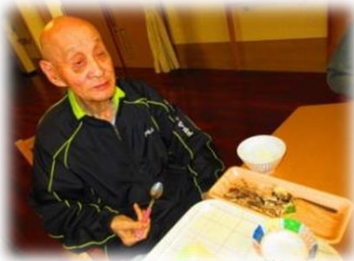
お昼に『さんま焼き師』の焼いた さんまをいただきました。

私は紫波町大巻で4人兄弟の長男として生まれ育ちました。 働きに出るようになってからは、農業をしながら地元の農協で 経理の仕事をしてきました。22歳で結婚し、2人の息子に恵 まれ、好きな野球をしながら元気に過ごしてきました。