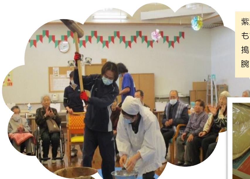
12月28日 にいやま荘での恒例の餅つきの様子

α-リノレン酸を原料にして、DHAやEPAが体内でつくられます。他にも中性脂肪を下げる作用、血栓ができるのを防止する作用、高血圧を予防する作用があると言われています。