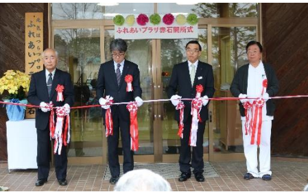
(移転開所式でのテープカットの様子)

新たな環境のもと、より充実したサービスを提供していきたいと思っております。 (サービス提供日:水・木・金) (年末年始、祝日を除く)