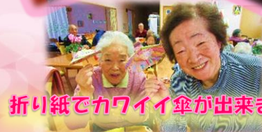
折り紙でカワイイ傘が出来ました