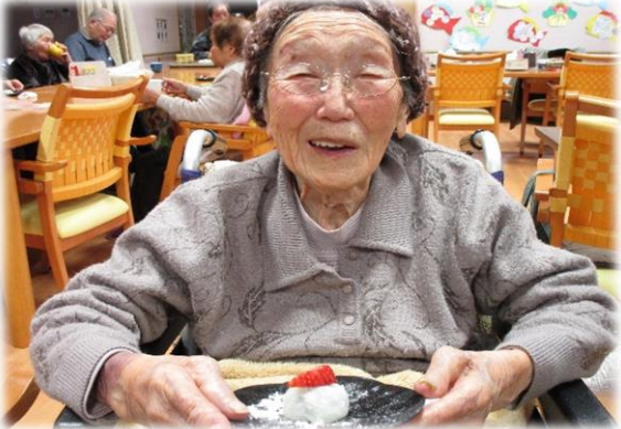
いちじく大梅、うまへんぎきたな

子どもの頃は、家が養蚕をやっていたので糸をとる手伝いや、田んぼの手伝いをしていました。近所の子どもの子守りもしました。その時守りした子とは今、デイサービスに一緒に通っています。こうしてまた会えてうれしいですね。