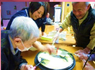
バレンタインデーにチョコバナナをどうぞ♡