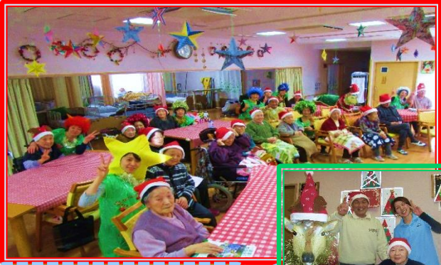
トナカイも参加して、皆さんでケーキをたべました♪