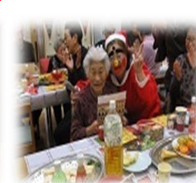
ひょんな顔したサンタだこと！

やすらぎ クリスマス 忘年会 盛岡チャペル様 ゴスペル♪♪♪ からの～ 安来節 からの～ サンタに変身！