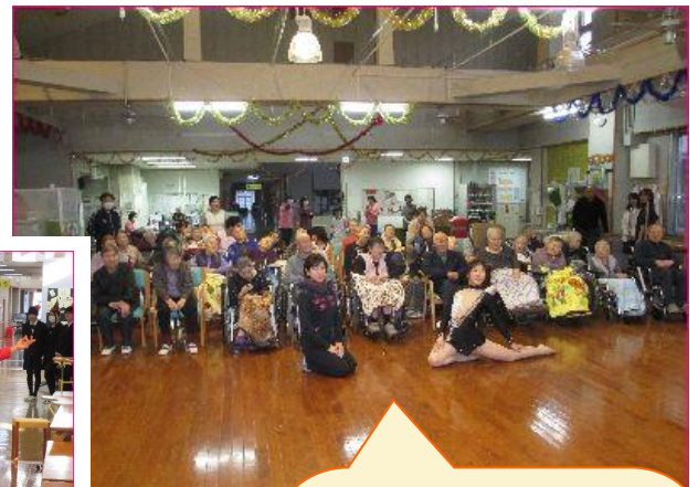
12月23日 北上湘南高校新体操部の 選手が来荘し、演技を披露し てくれました~。 リボンやボールを駆使した 柔軟な演技にびっくり、拍手 喝采でした！