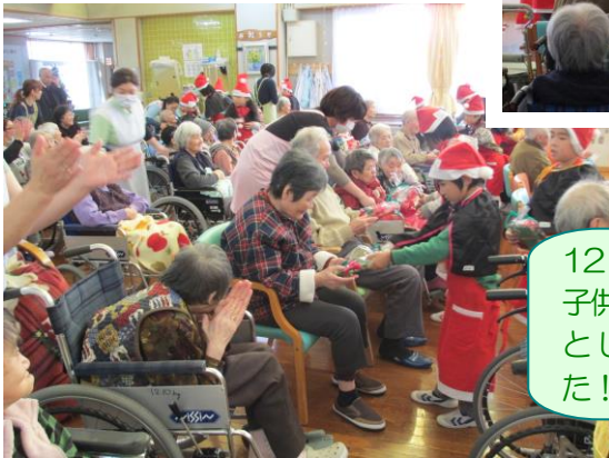
12月10日、彦部小学校の 子供たちが来荘し、手作りの としなを配ってくれました！