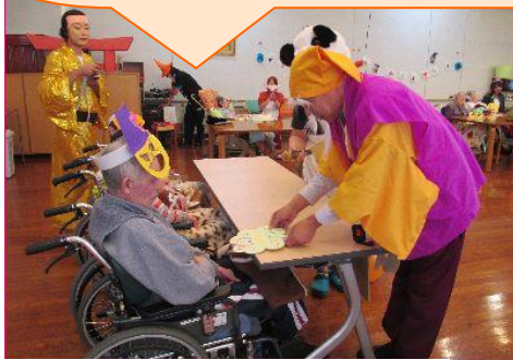
11月の誕生会はハロウィンパーティー♪ 職員それぞれが仮装して演出了ました。