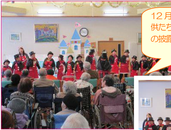
12月4日、日詰小学校の 子供たちが来荘し、唄やダンス の披露をしてくれました！