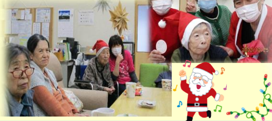
クリスマス忘年会