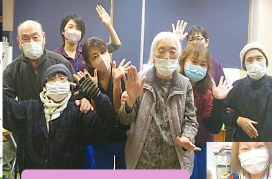
南昌スエさんはどこ？