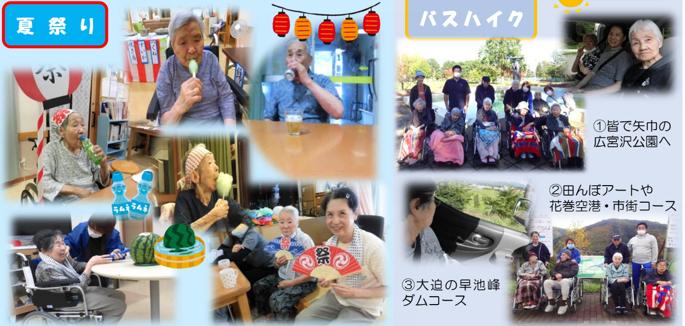
①皆で矢巾の 広宮沢公園へ