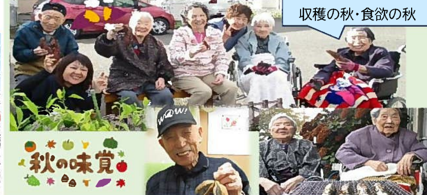
収穫の秋・食欲の秋