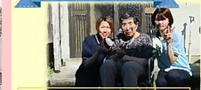
ご自宅で娘さんとひと休み