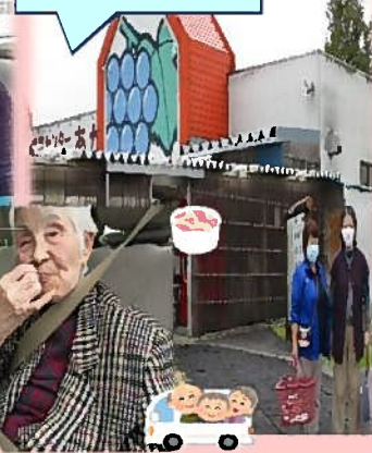
個別外出 in 宮古