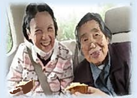
初詣は盛岡八幡宮へ